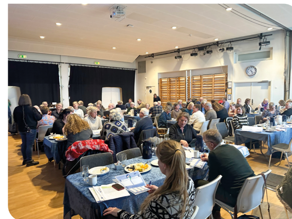
Billeder fra Temadag hvor der blev arbejdet på demensstrategien