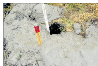
Et borehul. Det bedste er at finde et tykt lag gytje i jordlagene. For gytjen er god til at holde på vandet.

- Det bliver nok ikke i vores levealder, siger Line Magnussen.