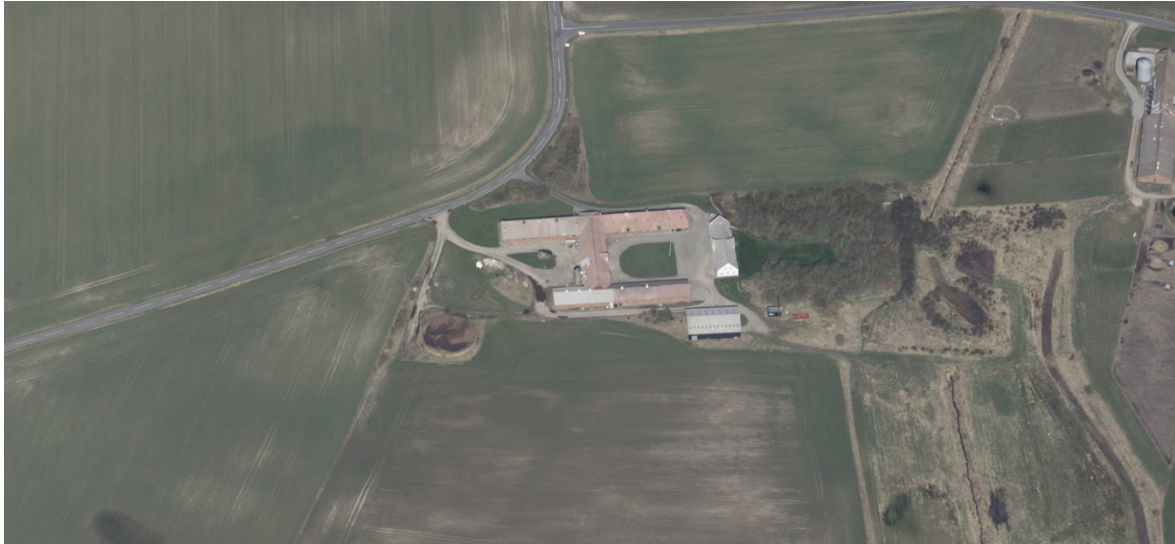
Skråfoto af Herpinggaard, 2023.

Lemvig Kommune vurderer, at der kan etableres teltoverdækning på gyllebeholderen på Transvej 75A, 7620 Lemvig som anmeldt, uden forudgående tilladelse efter husdyrbrugloven.