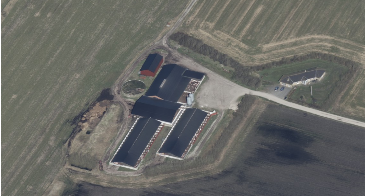
Skråfoto af Mosebøl, 2023.