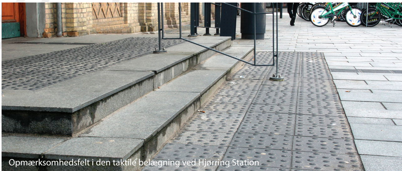
Opmærksomhedsfelt i den taktile belægning ved Hjørring Station