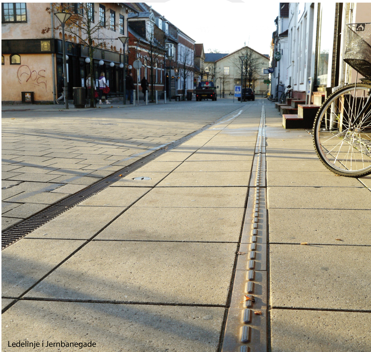
Ledelinje i Jernbanegade

Der nedsættes en følgegruppe sammensat på tværs af serviceområderne. Følgegruppen suppleres med to repræsentanter udpeget af Handicaprådet. Følgegruppen refererer til Direktionen. Følgegruppen evaluerer og følger op på igangsatte initiativer og kommer med forslag til næste års handleplan. Handleplanen skal koordineres med eksisterende planer og strategier for handicaptiltag på de enkelte serviceområder.