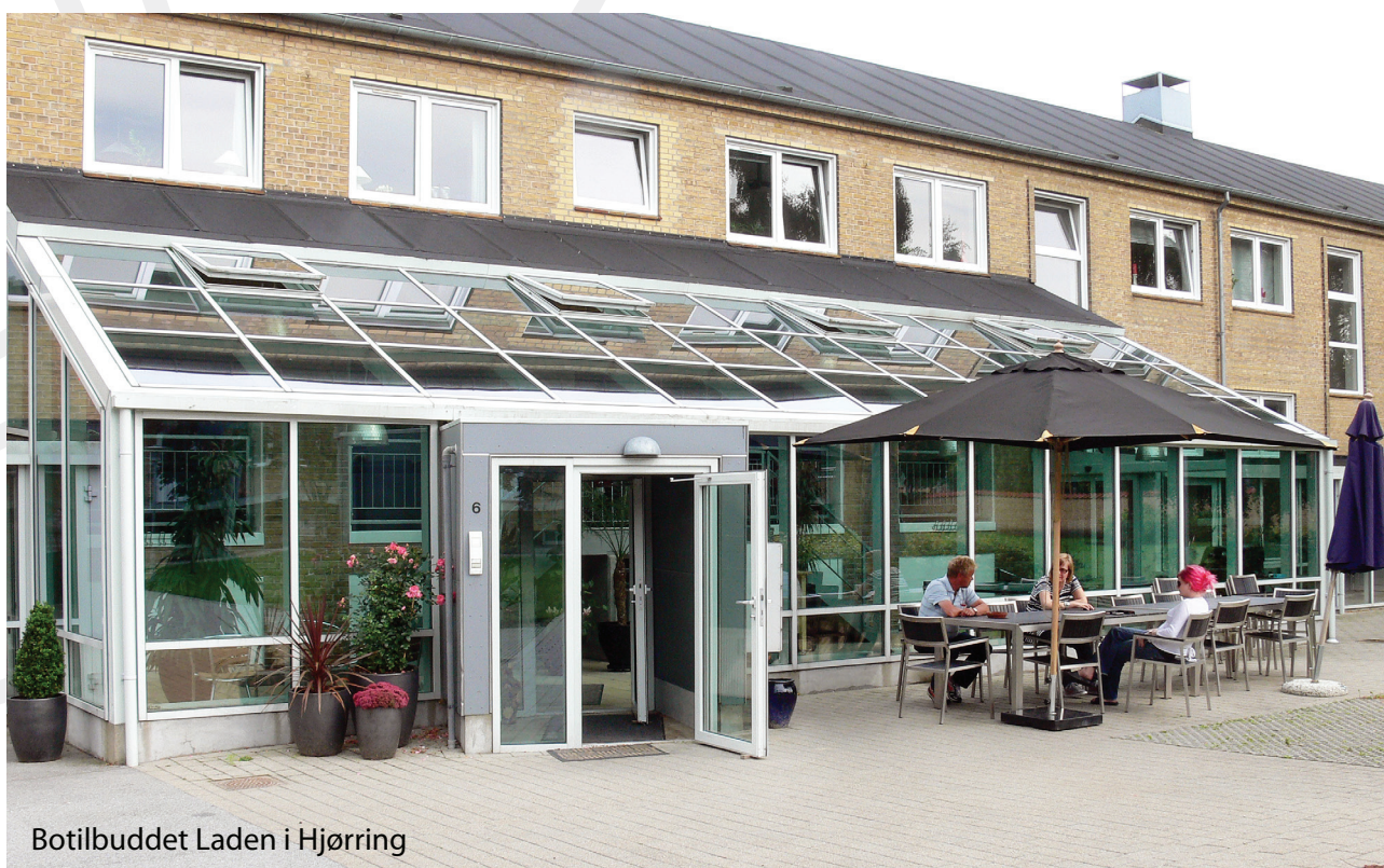
Botilbuddet Laden i Hjørring

“ Et hjem er et sted, hvor man kan lukke og låse sin dør. Et hjem sikrer tryghed. Et hjem er et sted, hvor man kan være privat. Et hjem er indrettet, så man kan fungere med mindst mulig hjælp. Et hjem er et sted, hvor man kan opføre sig "tosset" ”