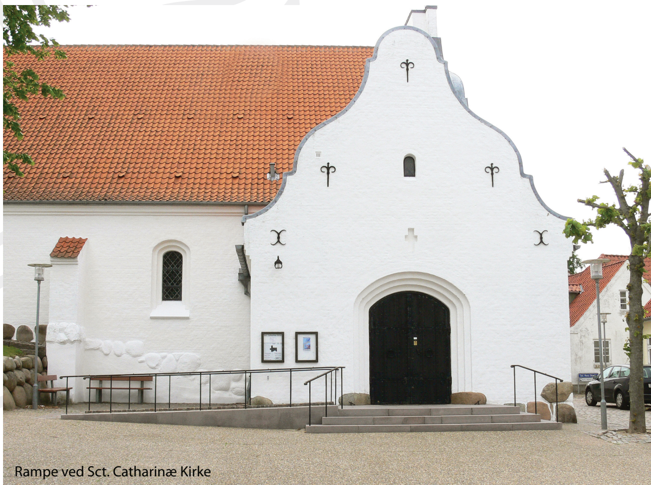
Rampe ved Sct. Catharinæ Kirke