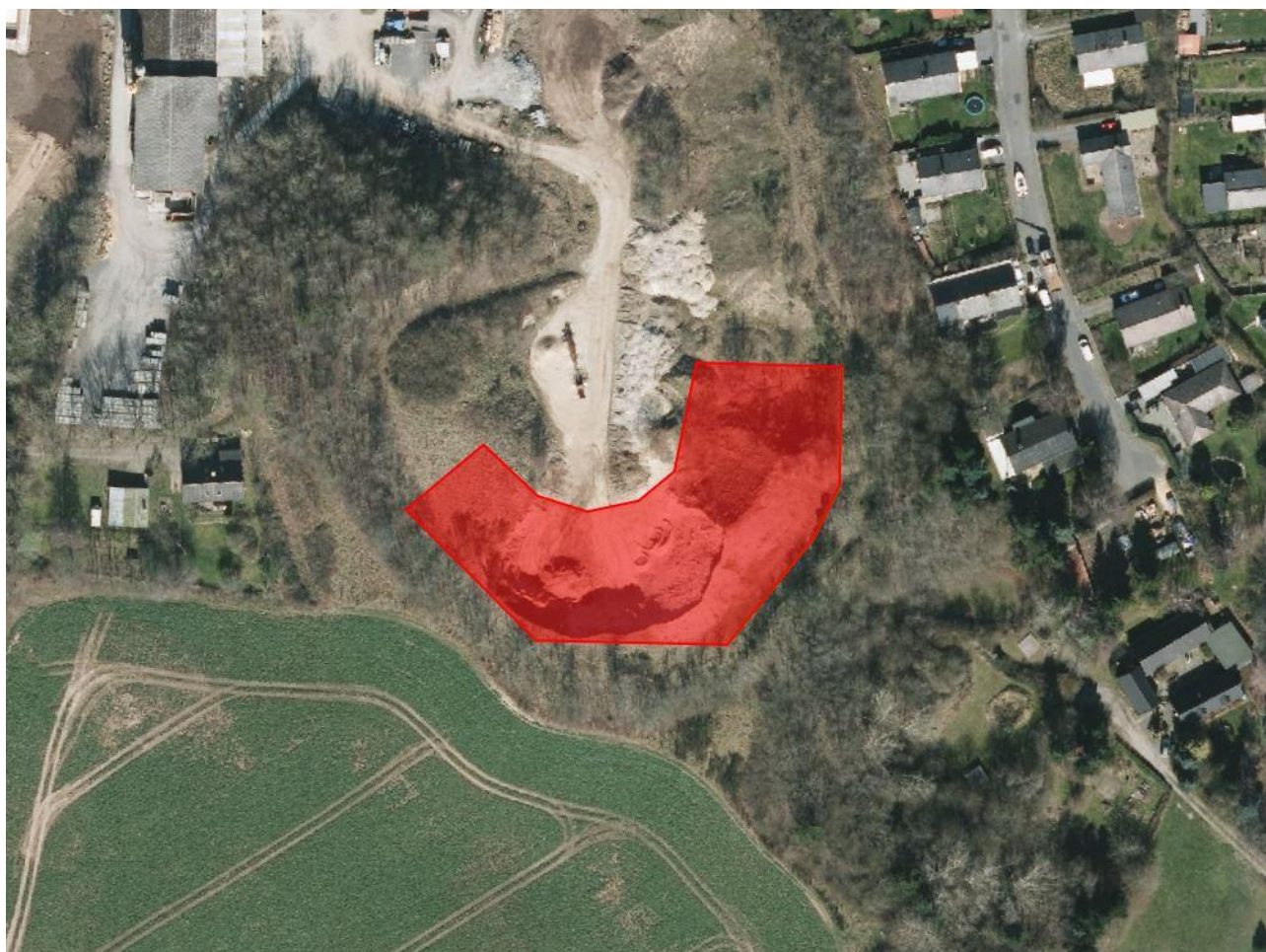
Graveområde markeret med rød